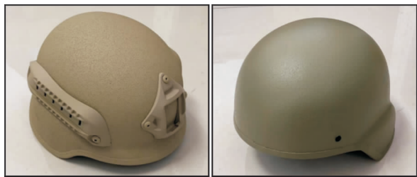
图 2 钛合金/芳纶纤维复合头盔照片

图 2 为西北有色金属研究院与国内多家防护装备单位合作研发的钛合金/芳纶纤维复合头盔。该复合头盔面密度为 7~8 kg/m 2 。使用 54 手枪发射的 51 式 7.62 mm 铅芯弹侵彻该头盔, 当弹丸速率为 445±10 m/s 时, 有效命中条件下头盔未穿透, 弹击弹痕高度小于 25 mm。